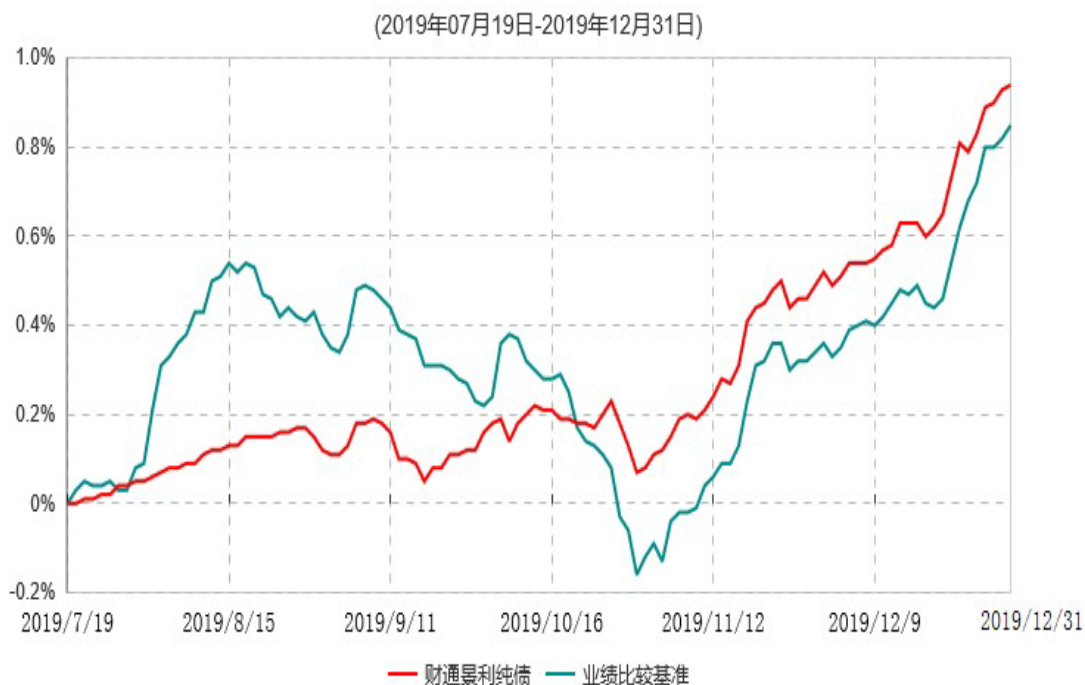
财通景利纯债债券型证券投资基金累计净值增长率与业绩比较基准收益率历史走势对比图

注：(1)本基金合同生效日为2019年07月19日，基金合同生效起至披露时点不满一年；