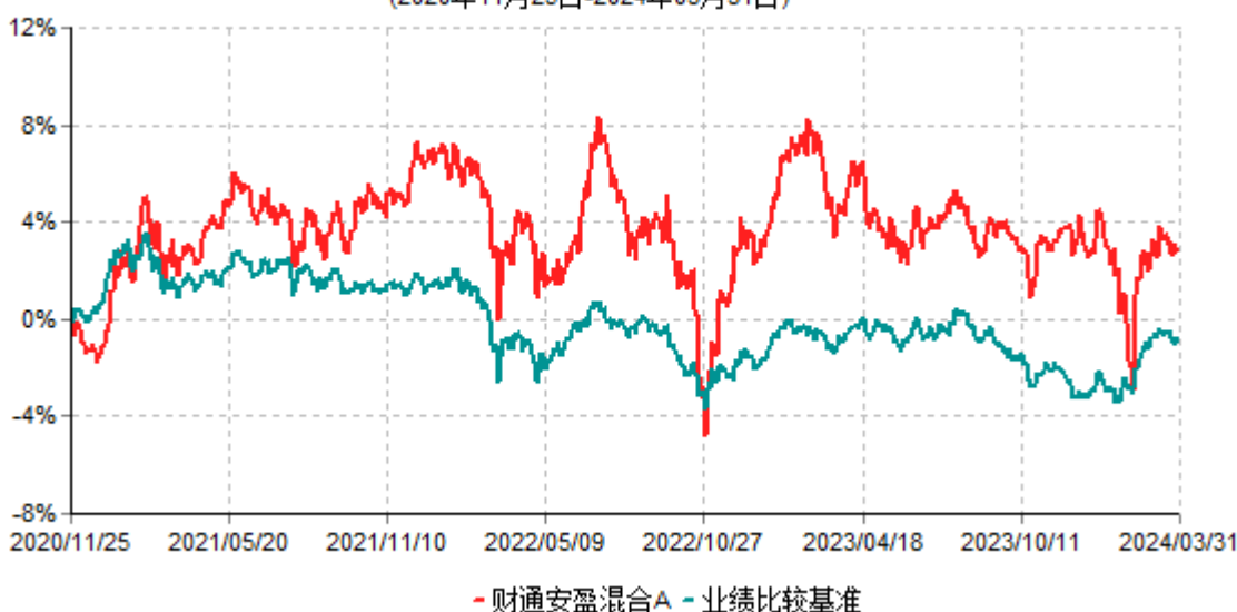
财通安盈混合A累计净值增长率与业绩比较基准收益率历史走势对比图 (2020年11月25日-2024年03月31日)