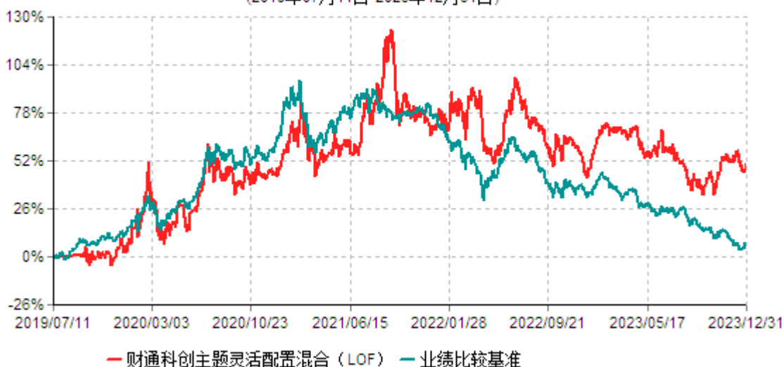
财通科创主题灵活配置混合型证券投资基金（LOF）累计净值增长率与业绩比较基准收益率历史走势对比图 (2019年07月11日-2023年12月31日)