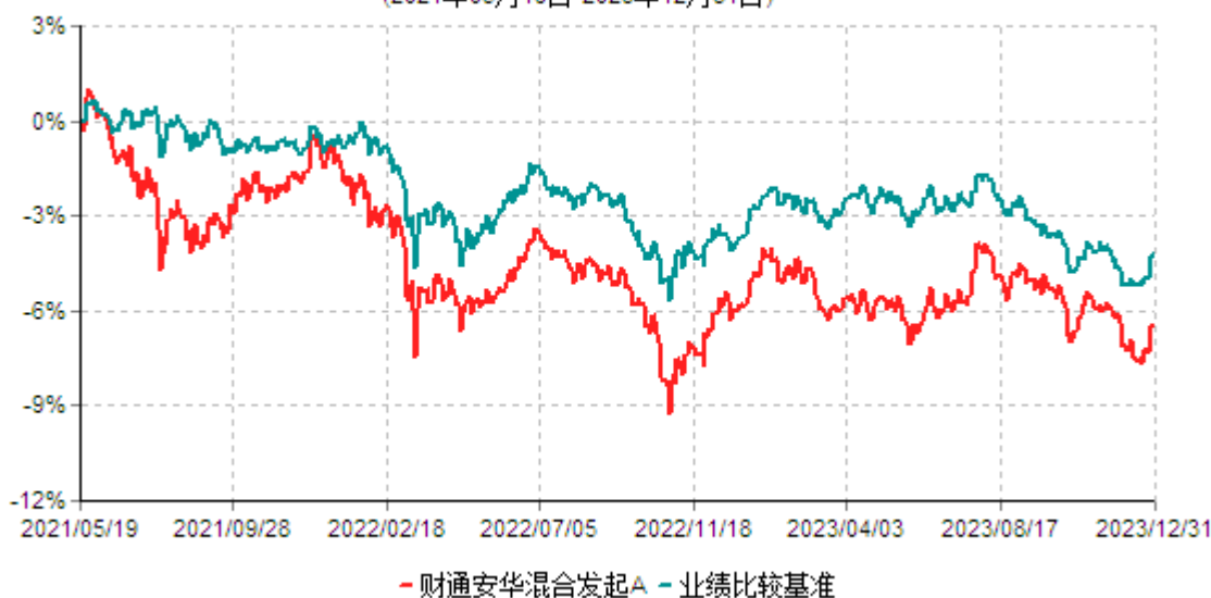
财通安华混合发起A累计净值增长率与业绩比较基准收益率历史走势对比图 (2021年05月19日-2023年12月31日)