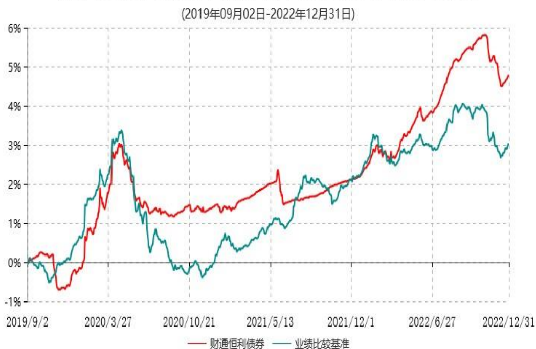
财通恒利纯债债券型证券投资基金累计净值增长率与业绩比较基准收益率历史走势对比图