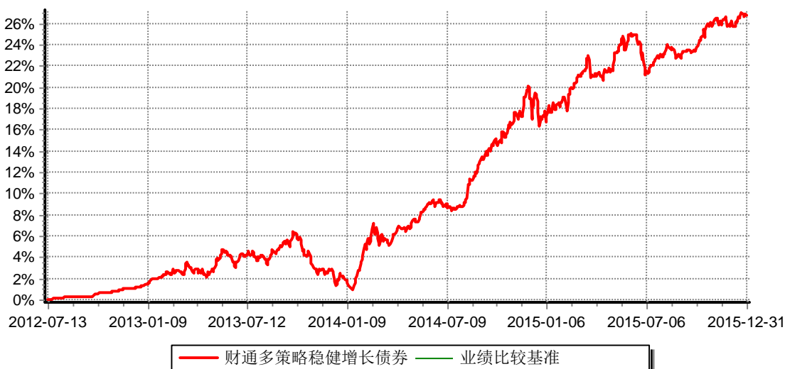
财通多策略稳健增长债券型证券投资基金 累计净值增长率与业绩比较基准收益率历史走势对比图 （2012年7月13日-2015年12月31日）