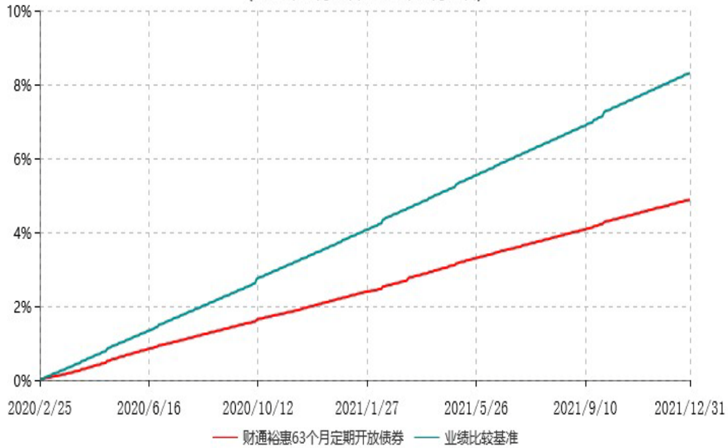
财通裕惠63个月定期开放债券型证券投资基金累计净值增长率与业绩比较基准收益率历史走势对比图 (2020年02月25日-2021年12月31日)