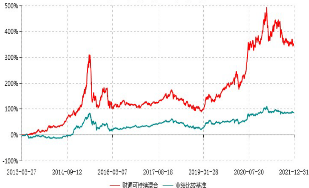
财通可持续发展主题混合型证券投资基金累计净值增长率与业绩比较基准收益率历史走势对比图 (2013年03月27日-2021年12月31日)