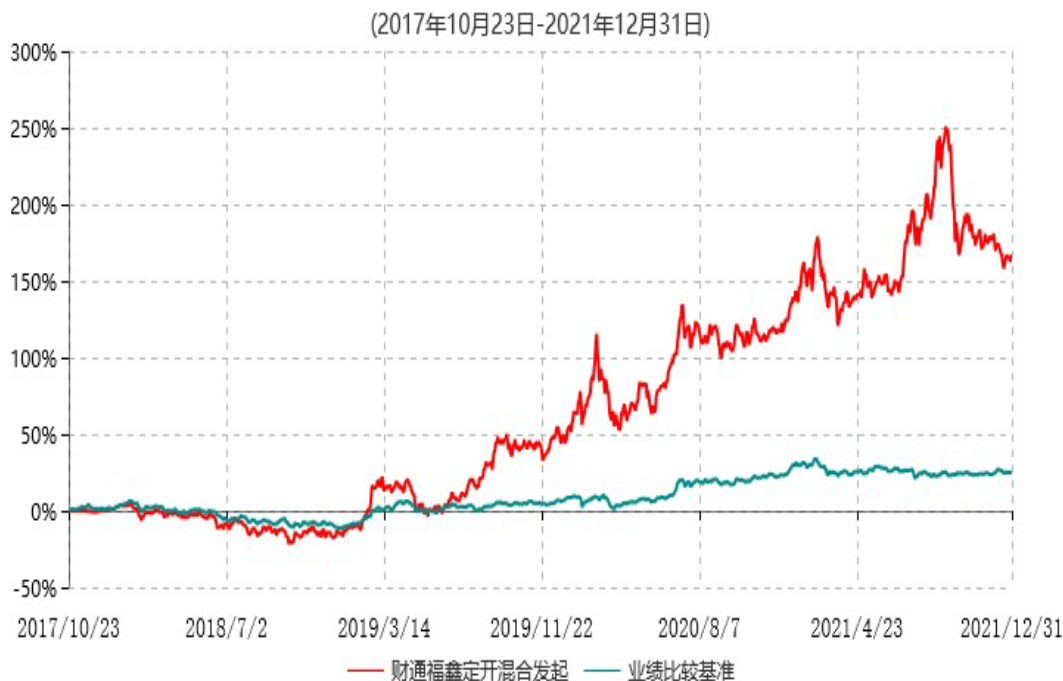
财通多策略福鑫定期开放灵活配置混合型发起式证券投资基金累计净值增长率与业绩比较基准收益率历史走势对比图