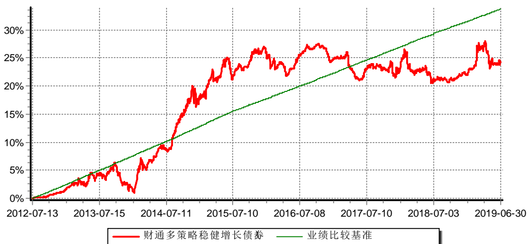
财通多策略稳健增长债券型证券投资基金A 累计净值增长率与业绩比较基准收益率历史走势对比图 (2012年7月13日-2019年6月30日)