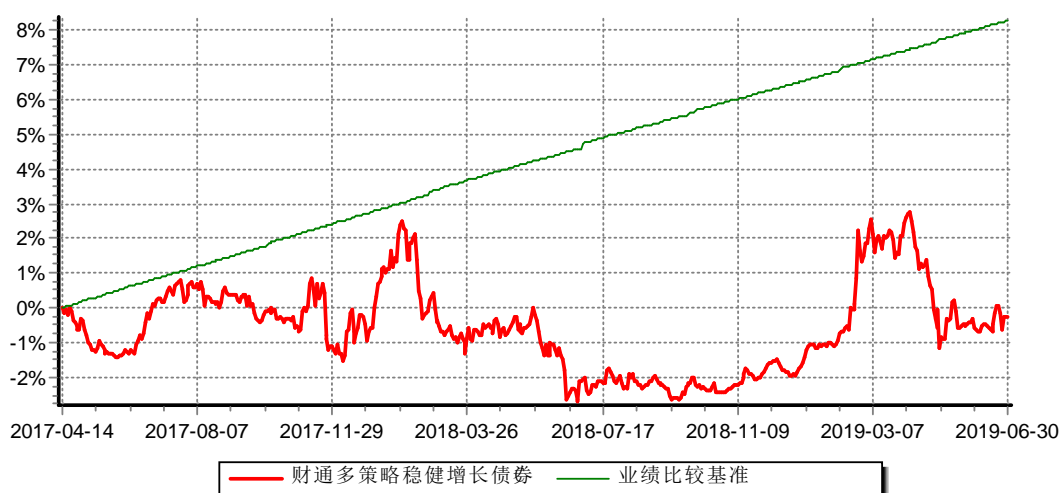
财通多策略稳健增长债券型证券投资基金C 累计净值增长率与业绩比较基准收益率历史走势对比图 (2017年4月14日-2019年6月30日)

(4)本基金自2017年4月14日起增设收取销售服务费的C类份额，原份额变更为A类份额。