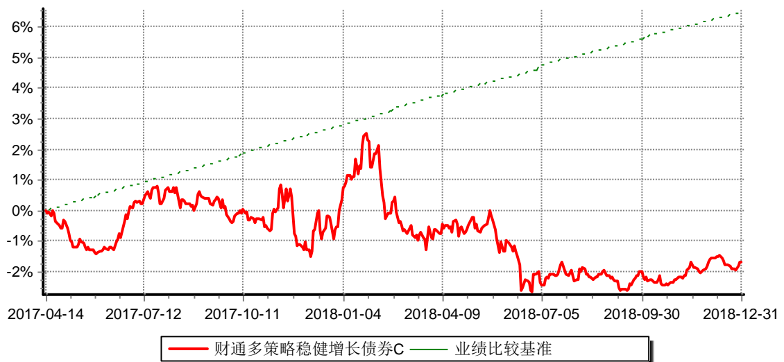
财通多策略稳健增长债券型证券投资基金C 累计净值增长率与业绩比较基准收益率历史走势对比图 (2017年4月14日-2018年12月31日)

(4) 本基金自2017年4月14日起增设收取销售服务费的C类份额，原份额变更为A类份额。