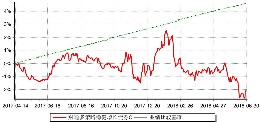
财通多策略稳健增长债券型证券投资基金C 累计净值增长率与业绩比较基准收益率历史走势对比图 (2017年4月14日-2018年6月30日)

(4) 本基金自2017年4月14日起增设收取销售服务费的C类份额，原份额变更为A类份额。