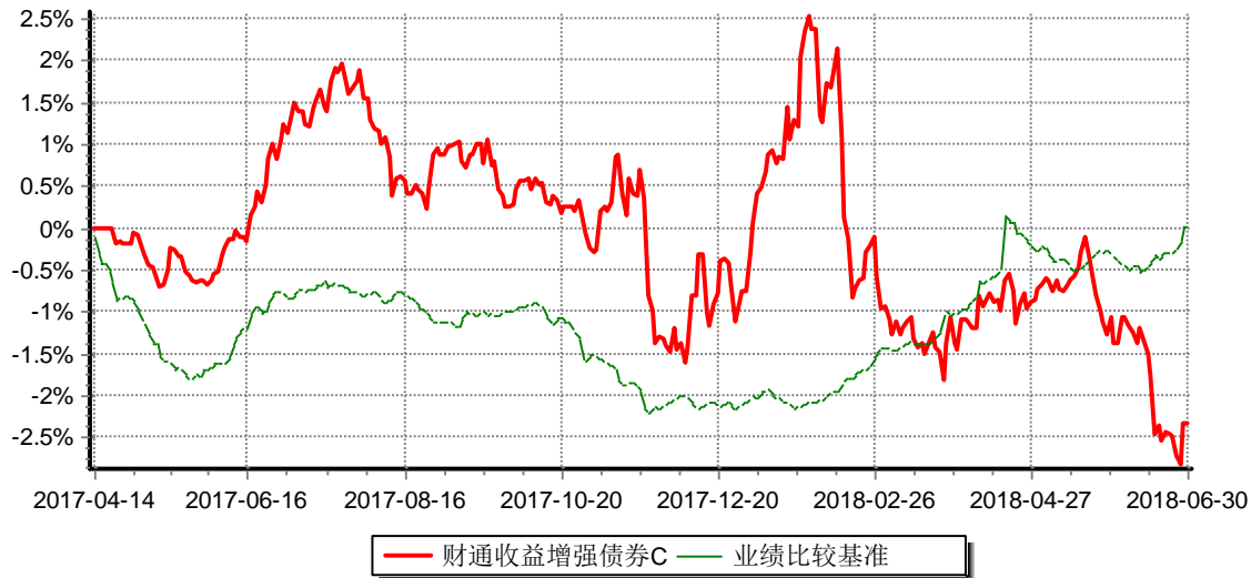
财通收益增强债券型证券投资基金C 累计净值增长率与业绩比较基准收益率历史走势对比图 (2017年4月14日-2018年6月30日)

注：(1)本基金合同生效日为2012年12月20日，根据合同规定，第一个保本周期到期日为2015年12月21日，本基金于2015年12月25日转型为非保本的债券型证券投资基金；