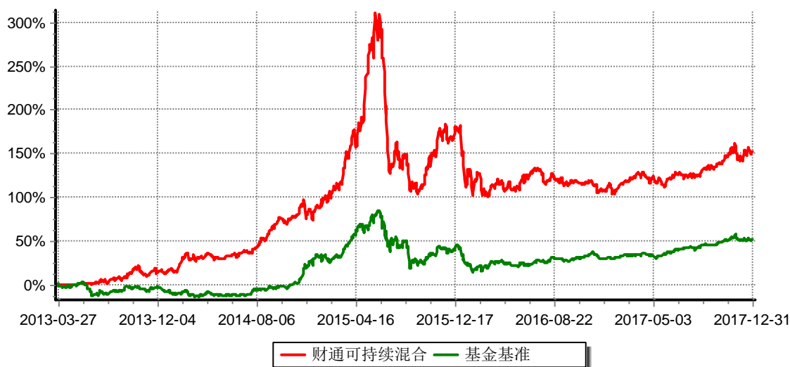
财通可持续发展主题混合型证券投资基金 累计净值增长率与业绩比较基准收益率历史走势对比图 (2013年3月27日-2017年12月31日)