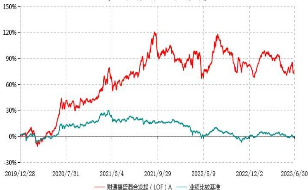
财通福盛混合发起（LOF）A累计净值增长率与业绩比较基准收益率历史走势对比图 (2019年12月28日-2023年06月30日)