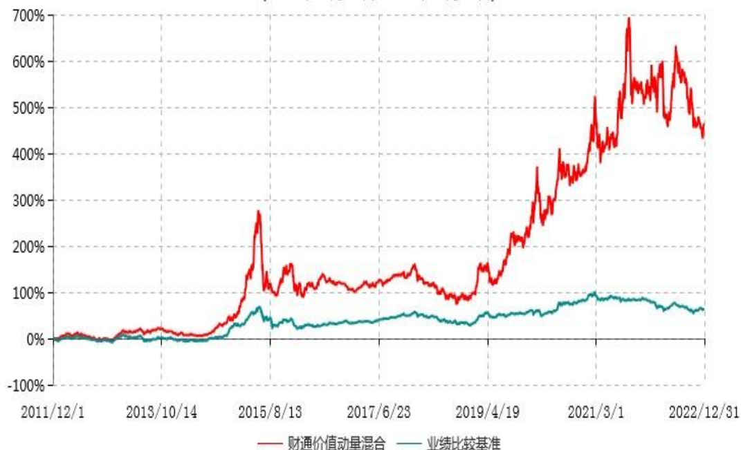
财通价值动量混合型证券投资基金累计净值增长率与业绩比较基准收益率历史走势对比图 (2011年12月01日-2022年12月31日)

注：(1)本基金合同生效日为2011年12月1日； (2)本基金建仓期是合同生效日起6个月，截至报告期末和基金建仓期末，基金的资产配置符合基金契约的相关要求。