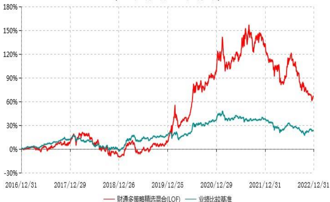
财通多策略精选混合型证券投资基金(LOF)累计净值增长率与业绩比较基准收益率历史走势对比图 (2016年12月31日-2022年12月31日)