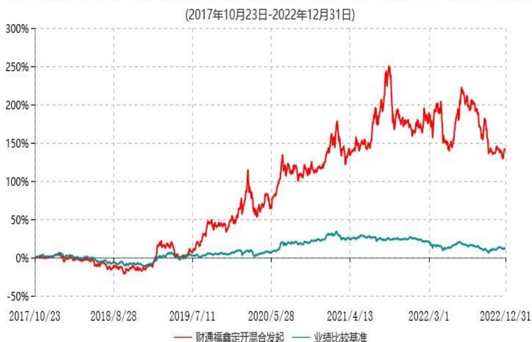
财通多策略福鑫定期开放灵活配置混合型发起式证券投资基金累计净值增长率与业绩比较基准收益率历史走势对比图